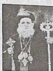
മോളി & അവാച്ചൻ, തിരുവനന്തപുരം